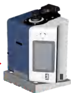
仪器倒置测试夹具